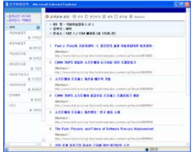
[그림 5] 최종 결과 화면

과학기술 DB 중 일부 DB 는 반드시 사용자 인증을 거쳐야 검색 및 결과보기를 할 수 있다. 따라서, 질의-결과 변환기에 이들 DB 의 사용자 인증을 할 수 있는 모듈을 추가하였다. 인증을 거쳐야 하는 DB 들은 cookie 를 통한 인증방식이기 때문에, 먼저 대표사용자 ID 와 패스워드를 질의-결과 변환기가 로그인을 수행하는 URL 에 넣어 인증을 하고 cookie 값을 얻어온다. 그 후 이 cookie 값과 사용자 질의를 같이 검색 URL 에 던져 검색을 수행한다.