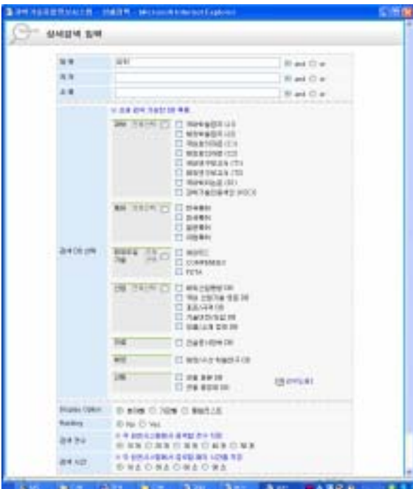
[그림 3] 상세 검색 화면

각 DB 마다 정의되어 있는 필드는 무척 다양하다. 통합검색에서는 공통된 필드만을 검색할 수 있으므로, 사용자에게 꼭 필요하면서 전체 DB 에서 공통된 필드를 잡는 일은 매우 중요하다. 25 개 DB 를 조사한 결과 제목-저자-초록 필드가 공통적으로 구성되어 있었다. 산림 DB 의 경우는 필드의 의미가 정확히 일치하지는 않아서 곤충명-제목, 채집자-저자로 유사한 의미를 찾아서 매핑시켰다.