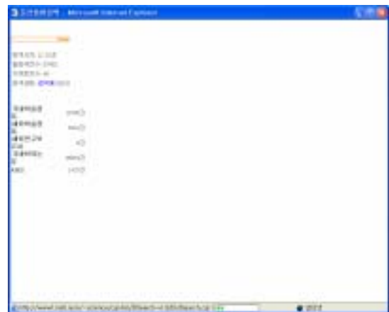
[그림 4] 동적 검색 화면

원천서버마다 검색에 소요되는 시간은 전부 다르다. 따라서, 원천 서버의 평균 검색 소요시간을 측정하여 적절한 타임 아웃값을 선택하는 일은 매우 중요하다. 25 개 DB 의 검색 시간을 측정하여 적절한 값인 30 초를 간략 검색 시간으로 잡아주었고, 상세 검색에서는 사용자가 선택할 수 있도록 하였다. 하지만 이렇게 다양한 시간을 선택 가능하도록 만들어도 문제가 될 수 있다. 최종적으로 검색이 완료된 후 결과를 사용자에게 보여줄 경우, 만약 일부 DB 가 검색에 소요되는 시간이 무척 오래 걸린다거나 서버가 다운되어 있을 경우 전체 결과가 화면에 보여지는 시간은 상당히 느리므로 사용자의 분산통합검색 시스템에 기대하는 신뢰도는 떨어진다. 과학기술종합정보 시스템에서는 일부의 DB 만이라도 검색되어 결과를 받는 즉시 결과건수와 DB 이름을 출력하면서 동적으로 화면을 갱신하도록 하여 사용자가 현재 검색이 잘 진행되고 있음을 느낄 수 있도록 하였다.