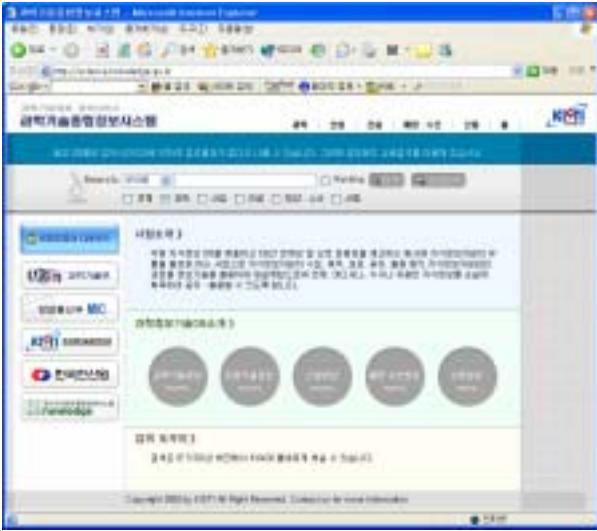
[그림 2] 간략 검색 화면